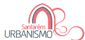
Ricardo Gonçalves Ribeiro Gonçalves